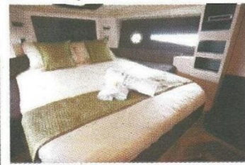
ภายในมีอุปกรณ์อำนวยความสะดวกครบครัน