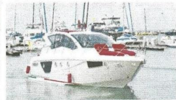
แคทรินซี เป็นเรือยอชต์ระดับหรู ผลิตโดยแคทรินซี อิตาลี เอสพีเอ บริษัทผู้ผลิตเรือยอชต์รายใหญ่ในอิตาลี