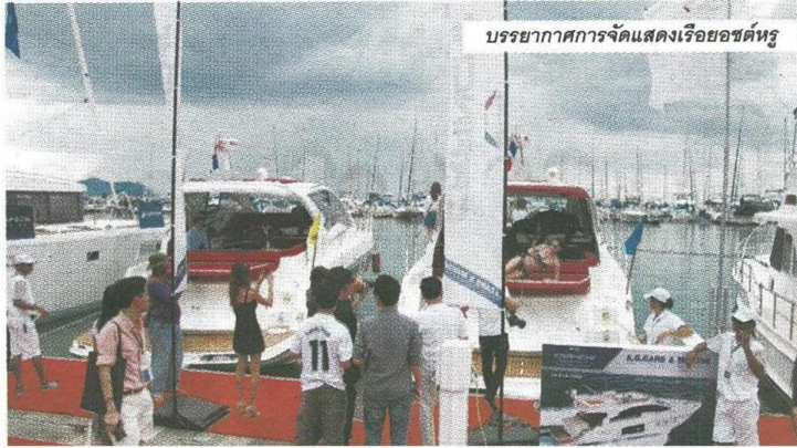
บรรยากาศการจัดแสดงเรือยอชต์หรู

โอเชียน มารีน่า สามารถเป็นตัวกลางให้ลูกค้ากับ ผู้เช่าได้