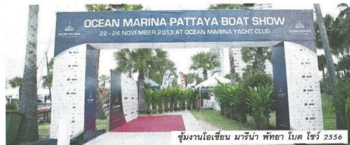
บูมงานโอเชียน มารีน่า พัทยา โบตโชว์ 2556

เฉียงใต้ และมีการขยายธุรกิจรองรับการเติบโตในทุก ๆ ปีซึ่งได้พัฒนาไปพร้อม ๆ กับการเติบโตของโครงสร้างพื้นฐานของพัทยา เพื่อยกระดับให้อยู่ในฐานะฮับของธุรกิจการท่องเที่ยวทางทะเลของเอเชียตะวันออกเฉียงใต้"